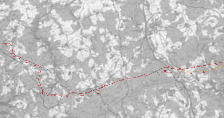
Limes im Rheingau-Taunus Kreis